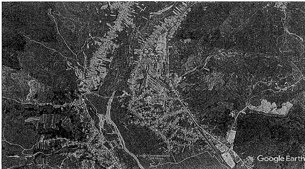
Imagine comuna, Doicești